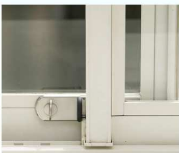
ロックした状態で換気できます